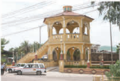
Kiosco Plaza Rotaria