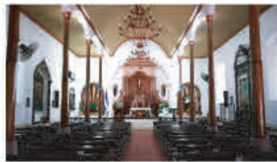
Atrio Iglesia Catedral

impresionantes templos religiosos que datan de tiempos de la colonia o las edificaciones muy bien preservadas. Una de las características más destacadas de este sureño departamento son sus playas de arena negra, que ofrece una gran variedad de opciones para disfrutar del sol y el mar.