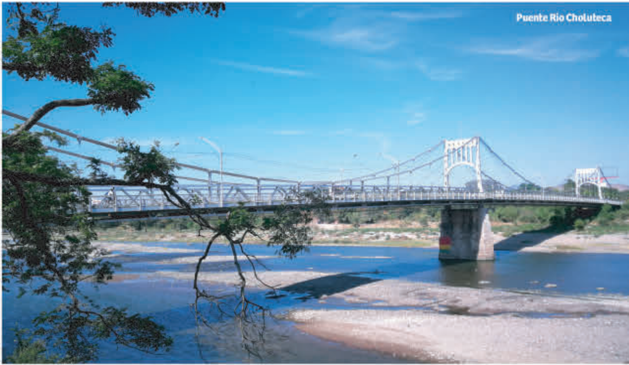
Puente Río Choluteca