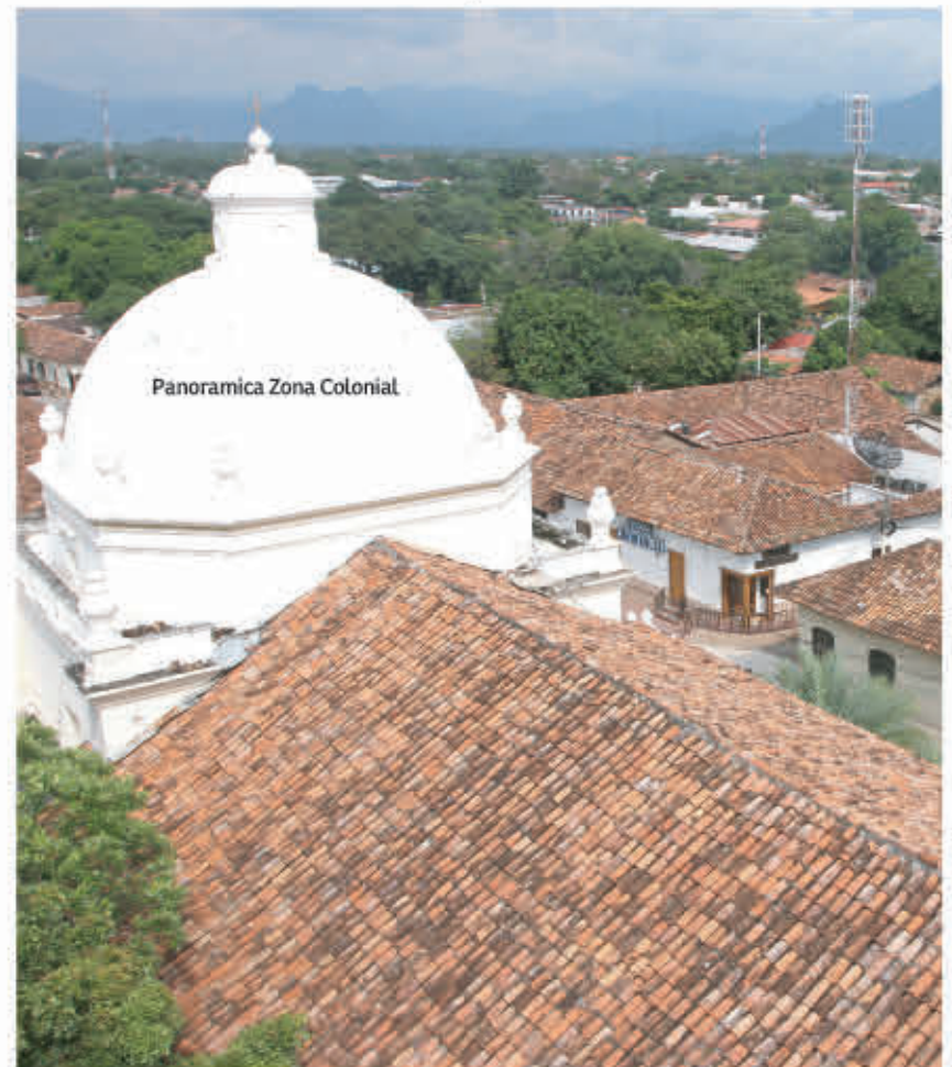
Panoramica Zona Colonial