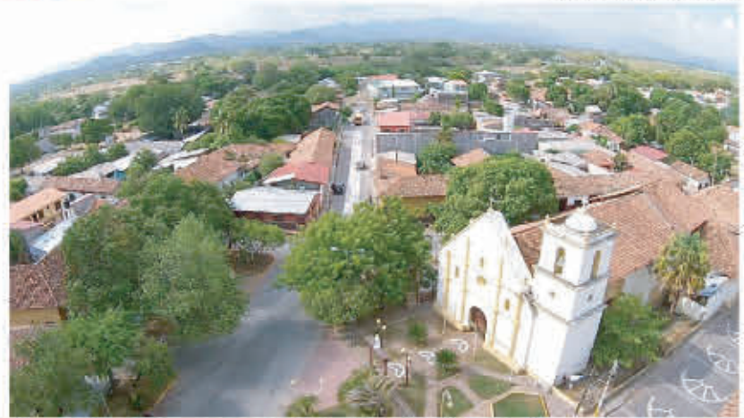
Aerea Iglesia La Merced

Si aún no tiene un lugar designado para visitar en este feriado Morazánico le sugerimos que visite La ciudad de Choluteca, desde dónde el turista puede recorrer todos los encantos que la zona sur tiene para descubrir.