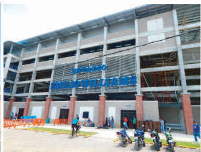
Estadio Emilio Williams