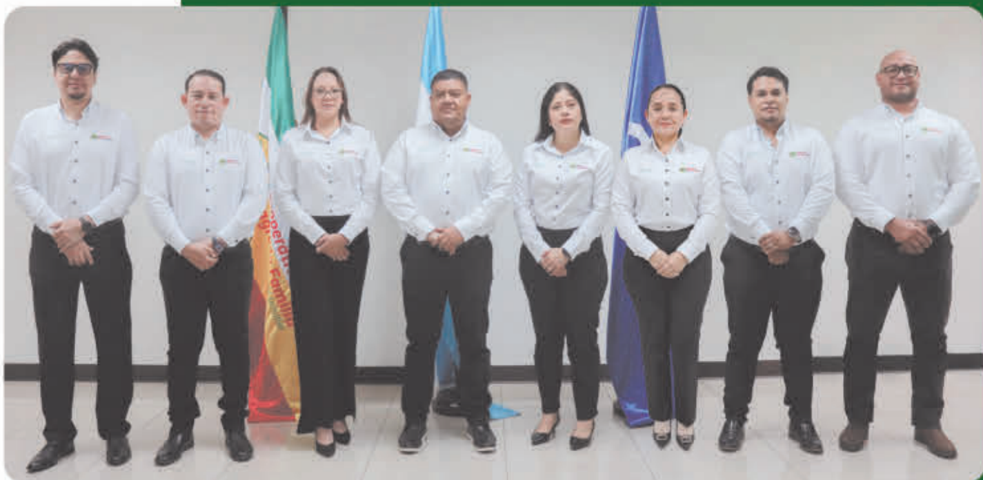
JUNTA DIRECTIVA Cooperativa de Ahorro y Crédito Sagrada Familia Ltda.

Saludos hermanos y hermanas Cooperativistas, Dios les bendiga.