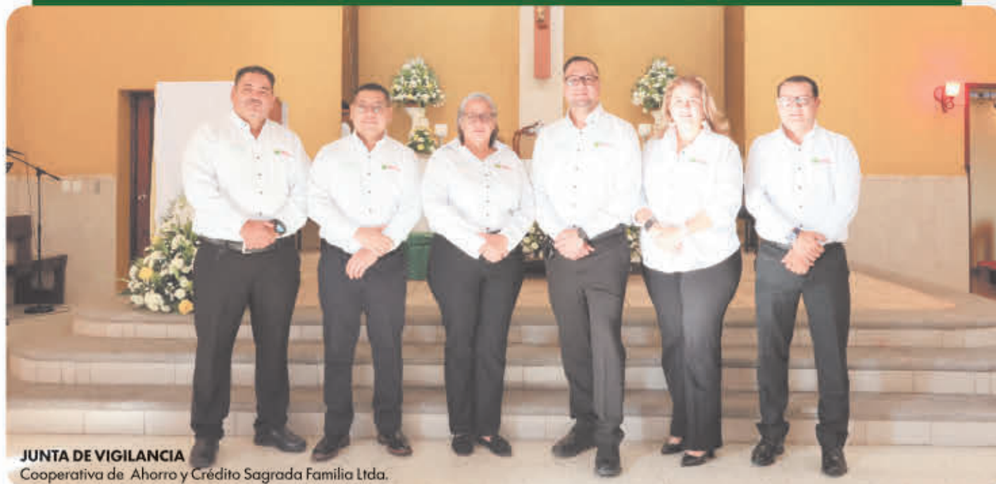
JUNTA DE VIGILANCIA Cooperativa de Ahorro y Crédito Sagrada Familia Ltda.

Saludos hermanos y hermanas Cooperativistas, Dios les bendiga.