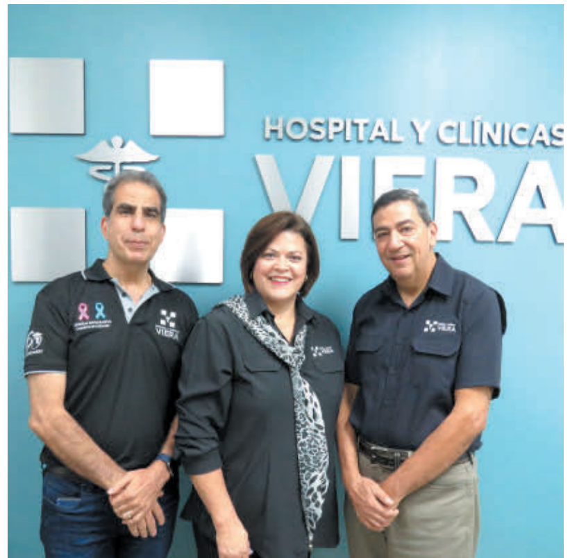
Comité Ejecutivo de Hospital y Clínicas Viera