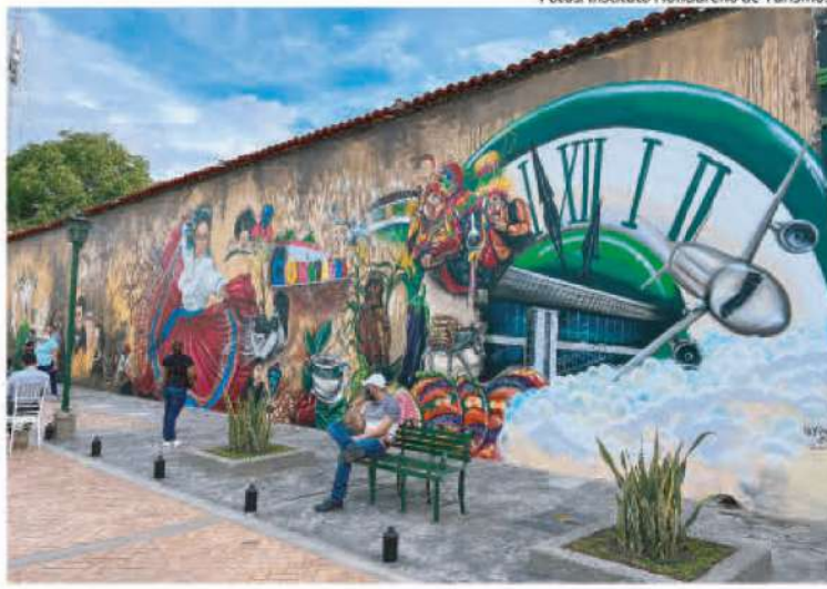
La historia del país, su biodiversidad y el que hacer de los habitantes desde tiempos pasados son rescatados en el mural.