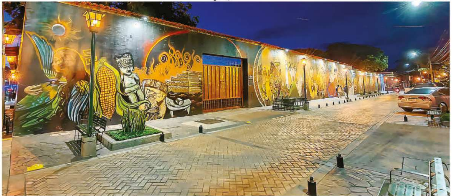
La obra se encuentra en una zona del centro histórico de la ciudad de Comayagua.