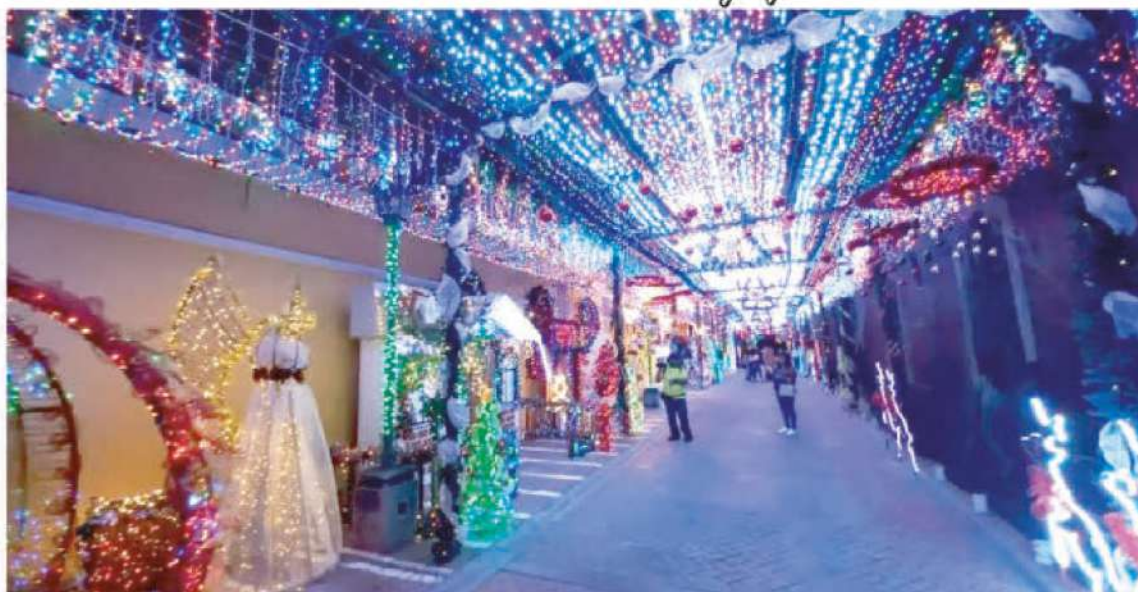
Un amplio programa de actividades se ha preparado para toda la familia ya inició.