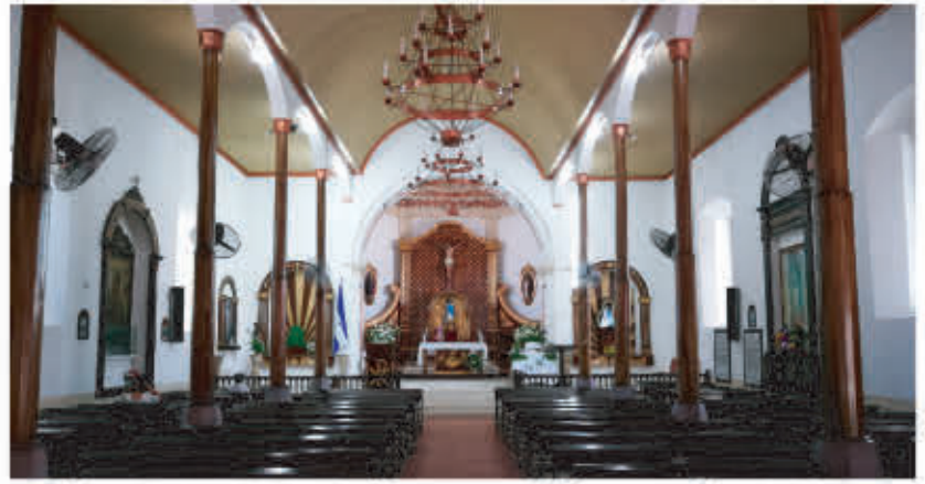
La ciudad de Choluteca, cabecera departamental tiene atractivos especiales que le cautivarán

Choluteca es uno de los departamentos más bellos y fascinantes de Honduras.