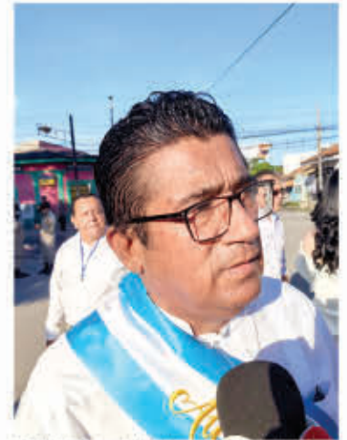
Quintín Soriano, alcalde del municipio de Cholulteca.