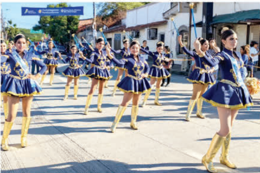
Las instituciones educativas celebran con un desfile este nuevo aniversario de la ciudad de Cholulteca.