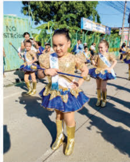
Niños y jóvenes de las diferentes instituciones educativas le rinden honor a su ciudad.

También se han sumado para desfilas varias bandas independientes como la Banda Quintín Soriano, Banda Chorotegas Latin Band, Banda Técnico Independiente, Banda Juvenil Filarmónica, Banda Independiente 0601, Banda Pacific Star, Banda Independiente Sureña (Bisur), Banda Cielo Sofía y la Banda Municipal 0601. Las esperadas carrozas también estarán deleitando a todos los habitantes de Cholulteca y este año han confirmado la participación las siguientes empresas e instituciones; Cooperativa Sanmarqueña, Ferreteria HERCO, Fisiosur, ConstruHome, Aguas de Cholulteca, Dirección de la Policía Nacional, Universidad Politécnica, Comercial Carbajal, MotoMundo, Canal Boom TV y Motos Elegant Tiuning Club.