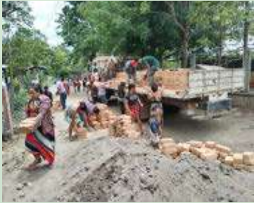
Proyectos Activos en Duyusupo, Los Ranchos, mesas de Cacamuya, El Gualiqueme entre otros