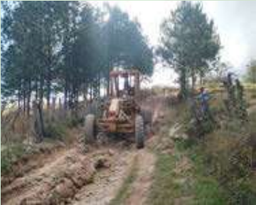
Carretera que conecta la comunidad de El Jocote con La Laguna