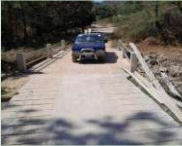
Proyecto de Huellas Vehiculares en Santa Rita y Caja Puente