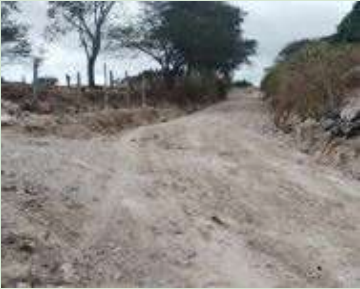
Mejoramiento carretera que conecta Duyusupo, La Mina y El Zarzal