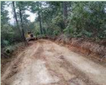
Reparación de la carretera que comunica las comunidades de Las Flores con la Laguna de Duyusupo