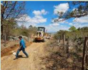
Reparación del acceso hacia la comunidad de El Sombrerito,