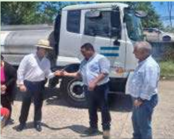
Gestión del Alcalde, ante el Banco Mundial, la Secretaría de Agricultura y Ganadería entrego camión cisterna.