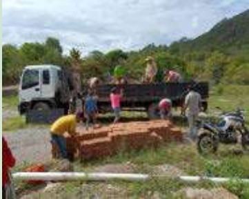
Entrega de material para construcción de pilas y baños Comunidad Aldea de San Juan de Duyusupo