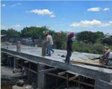
Ampliación y mantenimiento de caja puente Barrio Los Laureles