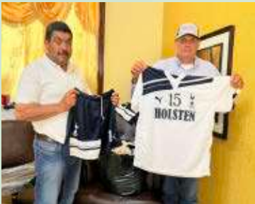
Entregamos un uniforme completo al equipo deportivo Monterrey de la comunidad de Ojo de Agua