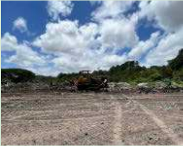
Limpieza del plantel y construcción de celda para acumulación de basura en el crematorio municipal