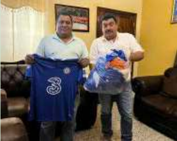
El Club Deportivo Atlético Comali entrega de su nuevo uniforme