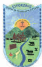
Alcaldía Municipal de San Marcos de Colón

9:00 AM Carrera de carros motos 1/4 de milla 6:00 PM Ultima gran corrida de toros, ganadería La Bendición y amenizada por Lucas y su norteño banda, en los predios de la Asociación de Ganaderos y Agricultores de San Marcos de Colón 7:00 PM Ultimo gran radio teatro en el pórtico de la feria 10:00 PM Quema del toro fuego y carnavalito gratis despidiendo la gran feria patronal de SAN MARCOS DE COLÓN FERISAMC 2025, en el pórtico de la feria