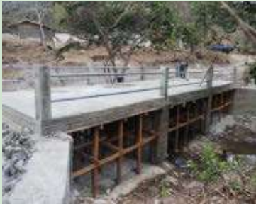
Construcción de Caja Puente, Comunidad de La Barranquilla