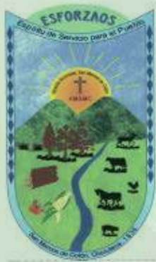
Alcaldía Municipal de San Marcos de Colón