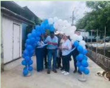
Junto Patronato del Barrio la Peña, Inauguración de pavimento de una calle más la construcción de una Caja Puente