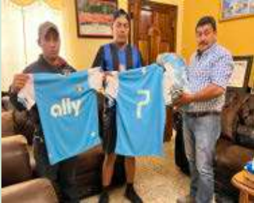
Entrega al equipo de fútbol Real Juventus de El Jocote de Duyusupo de uniforme completo