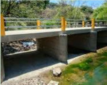
Construcción de Caja Puente en la Comunidad de Cacamuya