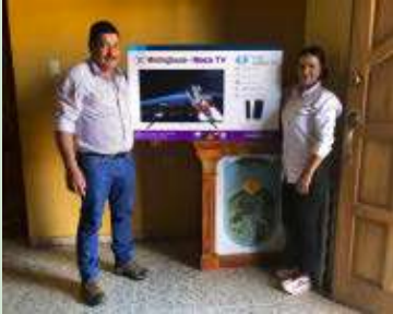
Donación de televisor al Jardín de Niños Domingo Enrique Calderón