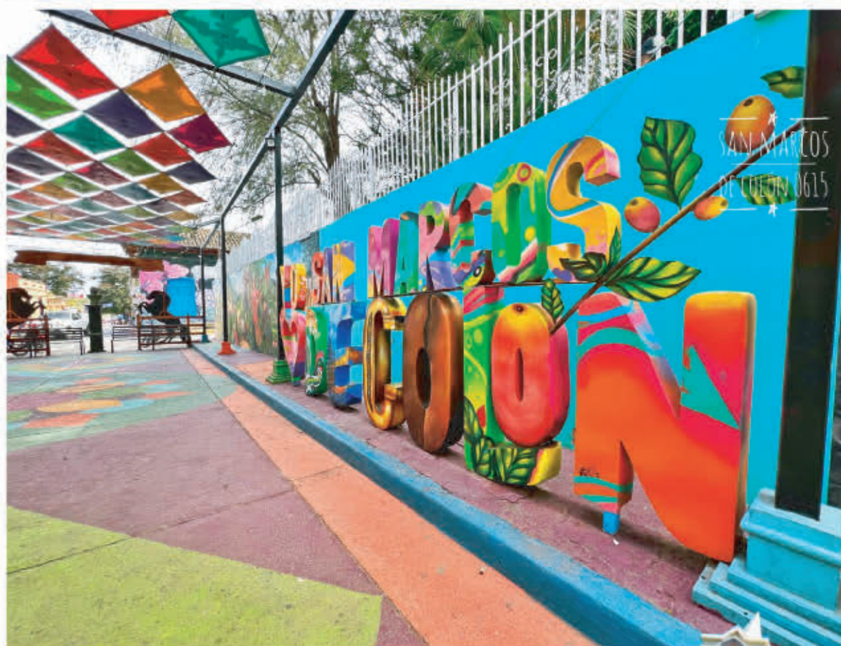
San Marcos de Colón 0615

E nelavado en el encantador departamento de Choluteca, San Marcos de Colón es un municipio que cautiva a sus visitantes con sus paisajes naturales, llenos de vida y belleza. Rodeado de montañas, con un clima fresco en comparación al resto del sur de Honduras, este pintoresco rincón se ha convertido en un destino que fusiona la tranquilidad del campo con una rica tradición cultural.