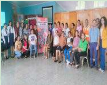
La Oficina Municipal de la Mujer y la Unidad de Equidad de Género de la SIT en capacitación mujeres y líderes comunidades