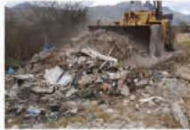
Eliminación de más de 20 botaderos clandestinos de basura en la ciudad