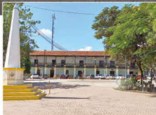
La ciudad de Juticalpa cuenta con hermosos sitios históricos, imponentes edificios, casas emblemáticas y templos.