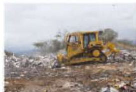
Reordenamiento e intervención del cementerio municipal antes desordenado ahora hasta con casetas de control

Los habitantes de Juticalpa viendo el dinamismo y entrega de sus servidores municipales más la honestidad de sus nuevas autoridades, también se han sumado al reto pagando al día sus impuestos, para desarrollar las obras que el municipio necesita en sus barrios, colonias, aldeas y caseríos. No cabe ninguna duda que de la mano de Dios y con un pueblo y autoridades dispuestas a trabajar sin descanso, Juticalpa se perfila para figurar entre los mejores municipios de Honduras.