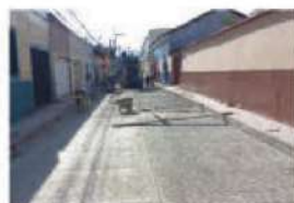
Pavimentación con concreto hidráulico de banquetas al Instituto Helen Luke en Barrio el Centro