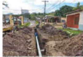
Instalación de taberna alcantarillado sanitario barrios y colonias ciudad