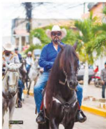
El tradicional desfile Hípico de la AGAO.

Rodeos, presentación de caballos de alta escuela, corridas de toros, exposición comercial, conciertos, son parte de las opciones que estarán dispuestas en las instalaciones de la Asociación de Ganaderos y Agricultores de Olancho (AGAO).