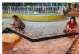
Vice alcaldesa Fanny Hércules prepara la estrofa de belén gigante que engalanara la plaza en la feria