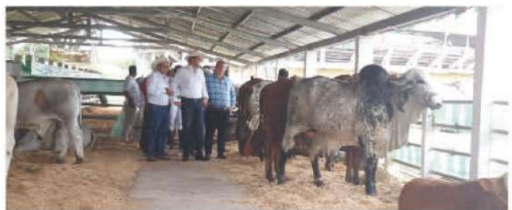
En las instalaciones de la AGAO, usted puede asistir a una serie de actividades.

A todo esto, se suma una singular competencia el V Concurso Regional del Caballo Iberoamericano, evento que se ha programado para el 11 de diciembre, día en que concluyen todas las actividades de esta edición de EXPOAGAO, puntualizó Espinal, presidente de los ganaderos de Olancho.