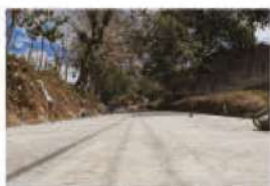
Pavimentación Barrio Calero hacia el CUROBO