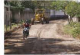
Antesierro y reparación de calles de terracería en la ciudad