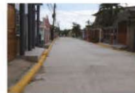
Pavimentación de varias calles en barrio la Hoja