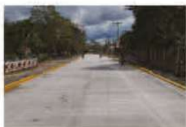
Pavimentación del centro de la comunidad tradicional de La Concepción