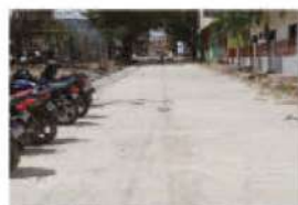
Pavimentación de la calle Taller Montero-Hondútil Barrio Jesús