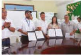
Creando alianzas para apoyar a la juventud y emprendedores