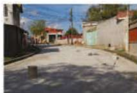
Pavimentación tramo cementerio general antiguo hacia el Boulevard Dr. Gustavo Ayes