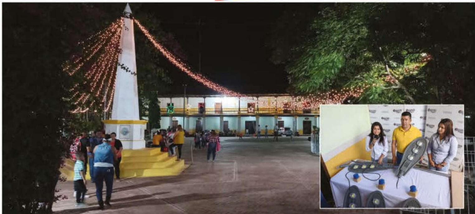
La gastronomía marina de la zona sur del país es insuperable.