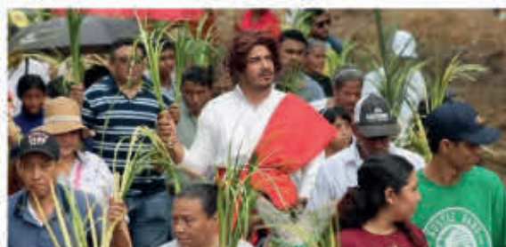
Domingo de Ramos.